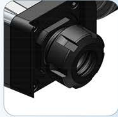
ER16 - ER25 ER32 - ER40