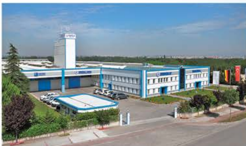
EROGLU TR - BURSA