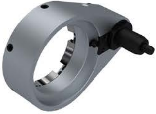
Standard Drehmomentarm Standart Torque Arm Standart Tork Kolu