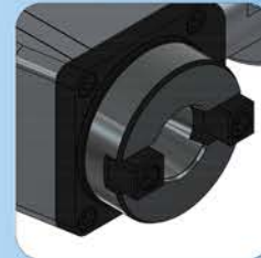
ISO30 Modular System

* Sonderaufnahmen gemäß Kundenspezifischen Anforderungen.