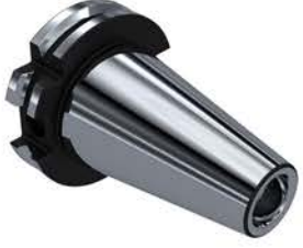
SK DIN ISO 7388-1 (DIN 69871)