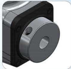
Ø12 - Ø20 Hydraulic Expansion Holder