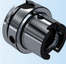
HSK (DIN 69893)