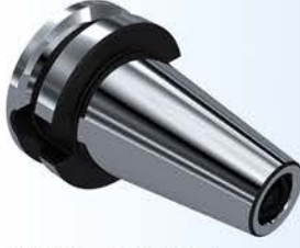
MAS 403 BT (JIS B 6339)