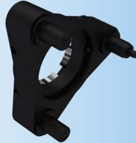
Drei-Stift Drehmomentarm Three-pin Torque Arm 3 Pimli Tork Kolu

Für automatischen Werkzeugwechsel einsetzbar Hergestellt aus hochlegiertem und widerstandsfähigem Spezial-Aluminiummaterial, dadurch leichter.