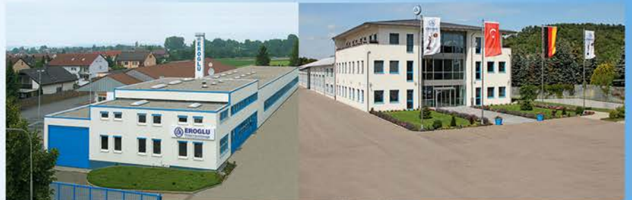
EROGLU DE - MÖSSINGEN