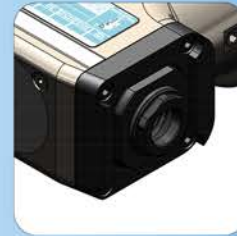
ER16S - ER25S ER32S