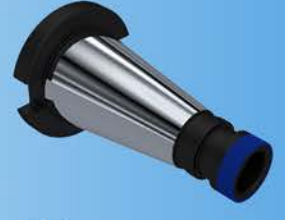
DK (DIN 2080)