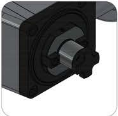
Ø16 - Ø22 Shell Mill Holder