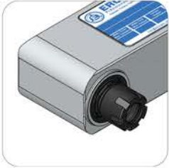
ER8 - ER11