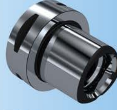
EPS (ISO 26623-1)